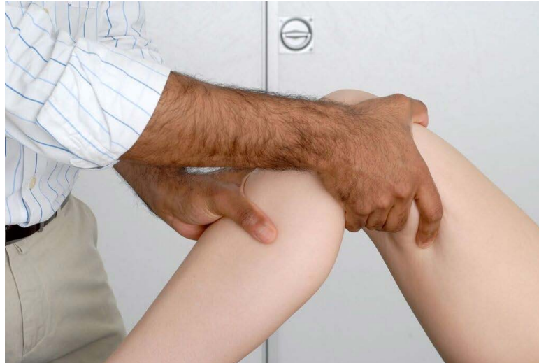
Démonstration du test du tiroir postérieur.