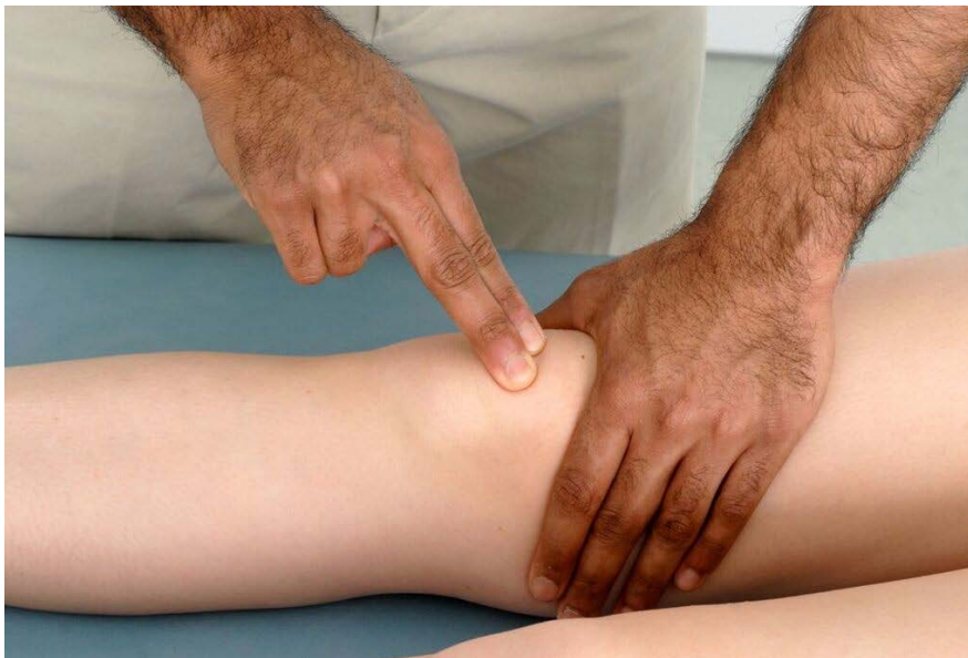
Démonstration du choc rotulien.

c) Mesurez la circonférence de la cuisse pour vérifier la fonte musculaire des quadriceps (à un point fixe au-dessus de la tubérosité tibiale, ou 10cm au-dessus du pôle supérieur de la rotule.