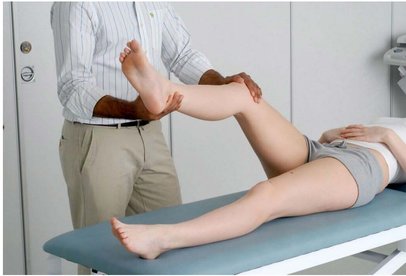
Démonstration du test de McMurray.