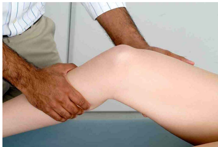
Testez le ligament latéral interne du genou.