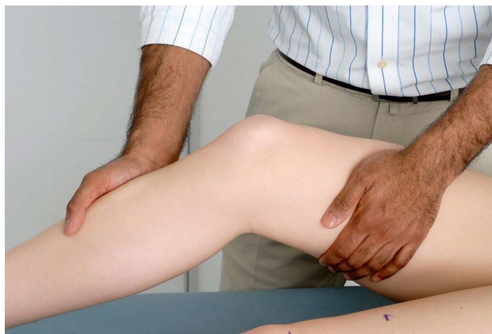
Testez le ligament latéral externe du genou.